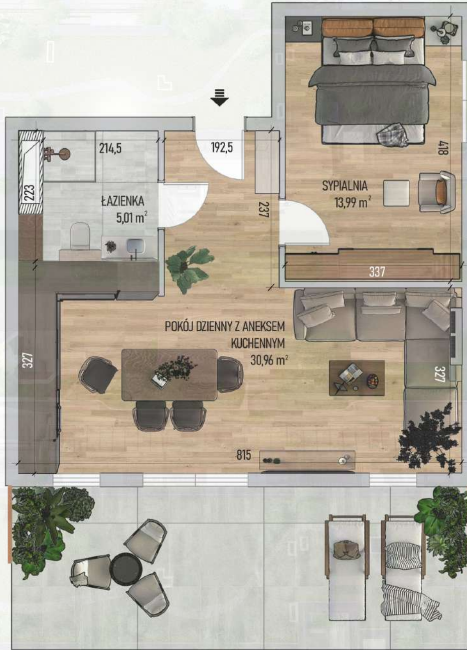
RZUT MIESZKANIA NR 2/ M63

Niniejszy projekt przedstawia przykładową aranżację. Mieszkania sprzedawane są w stanie deweloperskim bez wyposażenia. Podane wymiary są poglądowe i mogą ulec zmianie na etapie projektu wykonawczego i realizacji. Powierzchnie są liczone w świetle murów z warstwami wykończeniowymi.