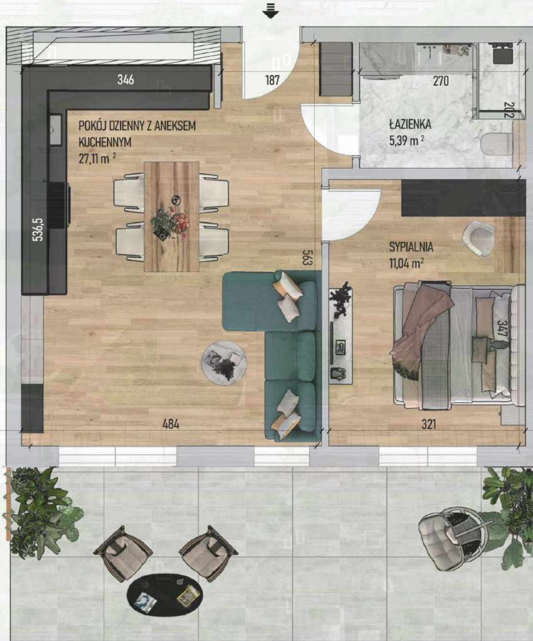
RZUT MIESZKANIA NR 2/ M62

Mniejszy projekt przedstawia przykładową aranżację. Mieszkania sprzedawane są w stanie deweloperskim bez wyposażenia. Podane wymiary są poglądowe i mogą ulec zmianie na etapie projektu wykonawczego i realizacji. Powierzchnie są liczone w świetle murów z warstwami wykończeniowymi