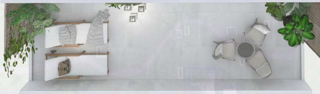
WIZUALIZACJA MIESZKANIA NR 2/ M61

Mniejszy projekt przedstawia przykładową aranżację. Mieszkania sprzedawane są w stanie deweloperskim bez wyposażenia. Podane wymiary są poglądowe i mogą ulec zmianie na etapie projektu wykonawczego i realizacji. Powierzchnie są liczone w świetle murów z warstwami wykończeniowymi.