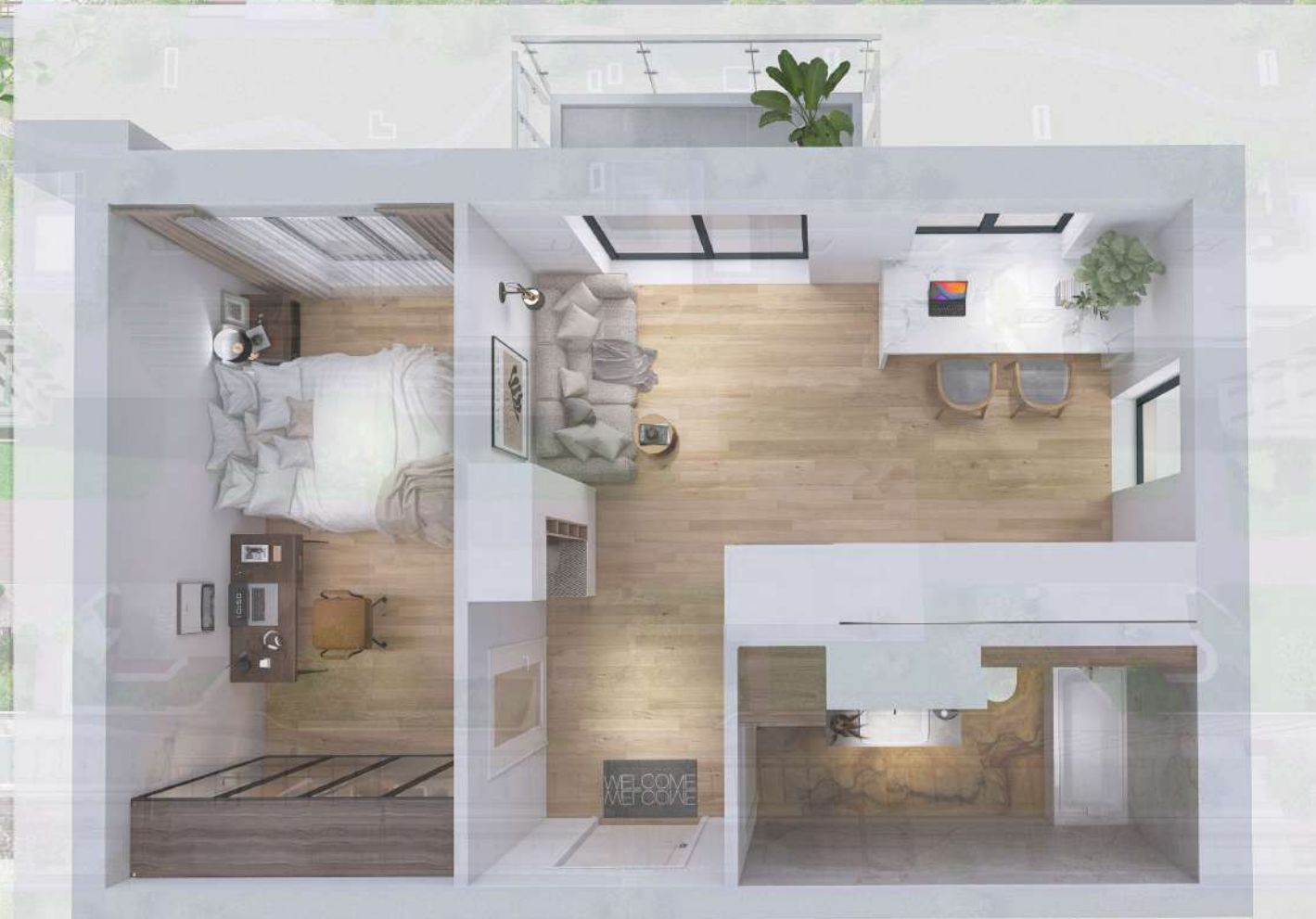
WIZUALIZACJA MIESZKANIA NR 2/ M85

Niniejszy projekt przedstawia przykładową aranżację. Mieszkania sprzedawane są w stanie deweloperskim bez wyposażenia. Podane wymiary są poglądowe i mogą ulec zmianie na etapie projektu wykonawczego i realizacji. Powierzchnie są liczone w świetle murów z warstwami wykończeniowymi