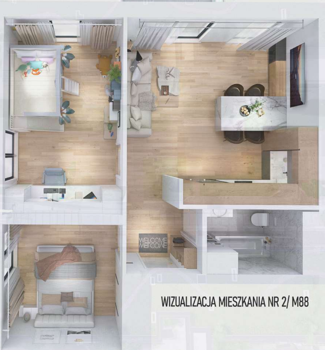
WIZUALIZACJA MIESZKANIA NR 2/ M88

Mniejszy projekt przedstawia przykładową aranżację. Mieszkania sprzedawane są w stanie deweloperskim bez wyposażenia. Podane wymiary są poglądowe i mogą ulec zmianie na etapie projektu wykonawczego i realizacji. Powierzchnie są liczone w świetle murów z warstwami wykończeniowymi