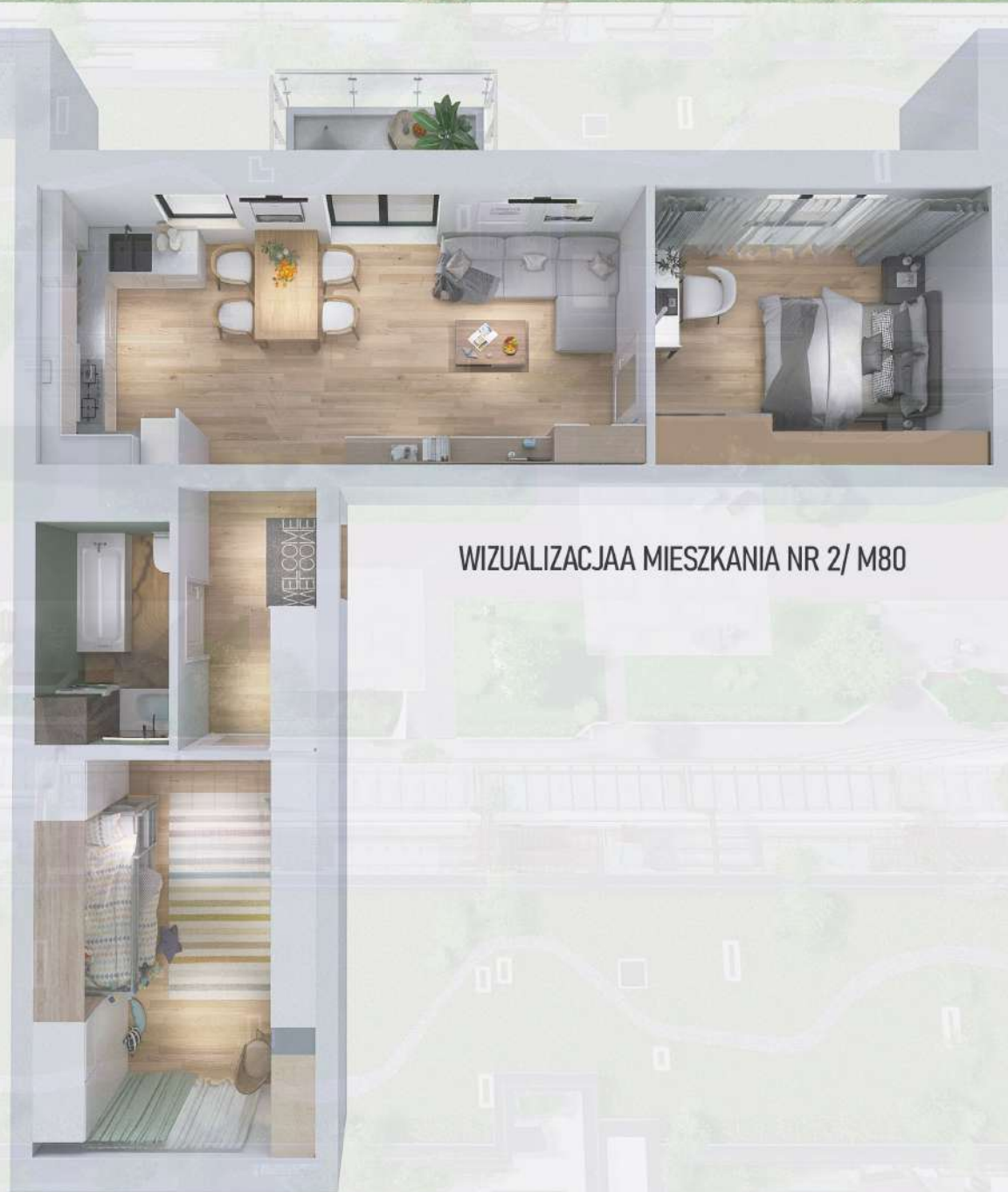
WIZUALIZACJAA MIESZKANIA NR 2/ M80

Niniejszy projekt przedstawia przykładową aranżację. Mieszkania sprzedawane są w stanie deweloperskim bez wyposażenia. Podane wymiary są poglądowe i mogą ulec zmianie na etapie projektu wykonawczego i realizacji. Powierzchnie są liczone w świetle murów z warstwami wykończeniowymi