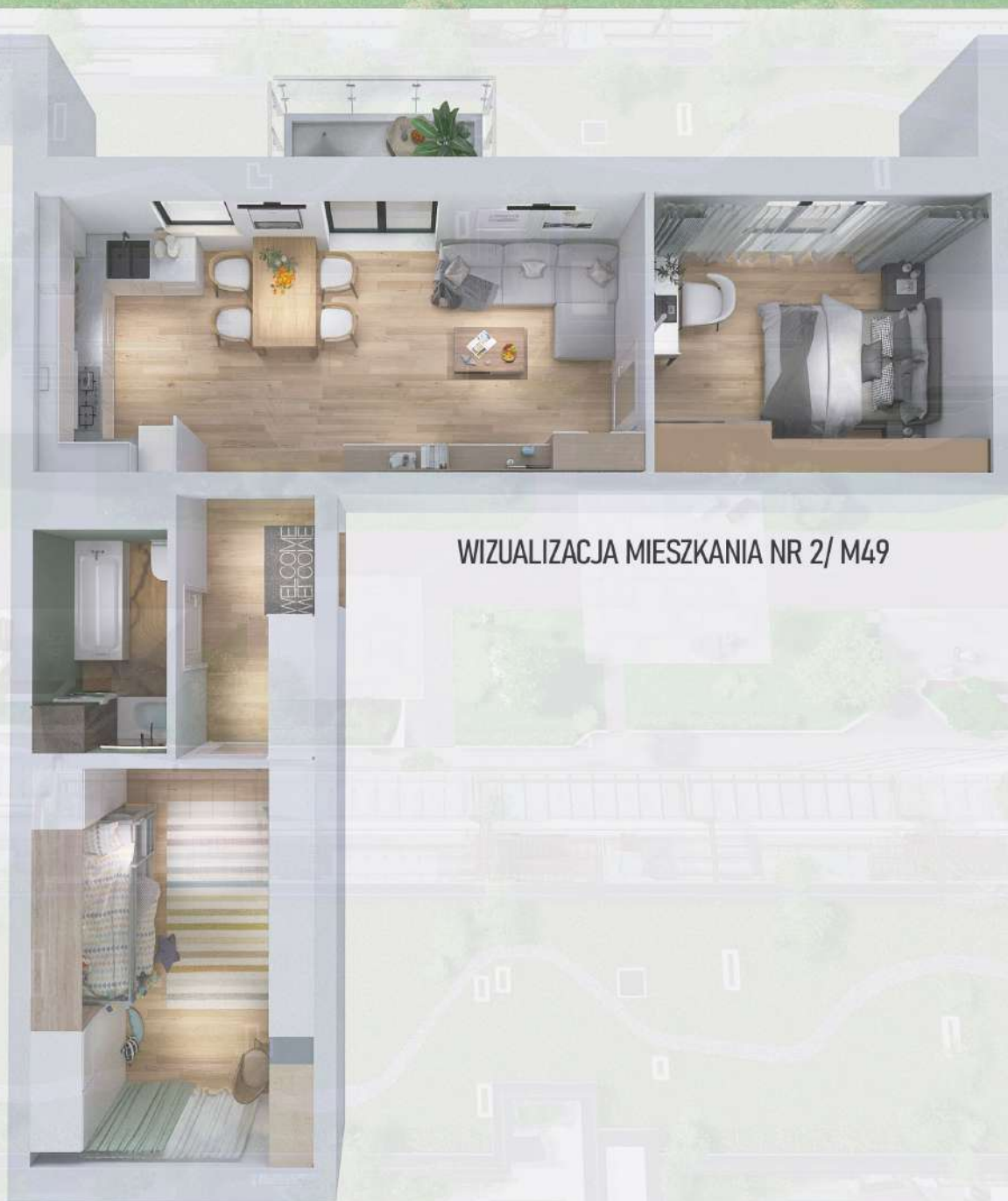
WIZUALIZACJA MIESZKANIA NR 2/ M49

Niniejszy projekt przedstawia przykładową aranżację. Mieszkania sprzedawane są w stanie deweloperskim bez wyposażenia. Podane wymiary są poglądowe i mogą ulec zmianie na etapie projektu wykonawczego i realizacji. Powierzchnie są liczone w świetle murów z warstwami wykończeniowymi