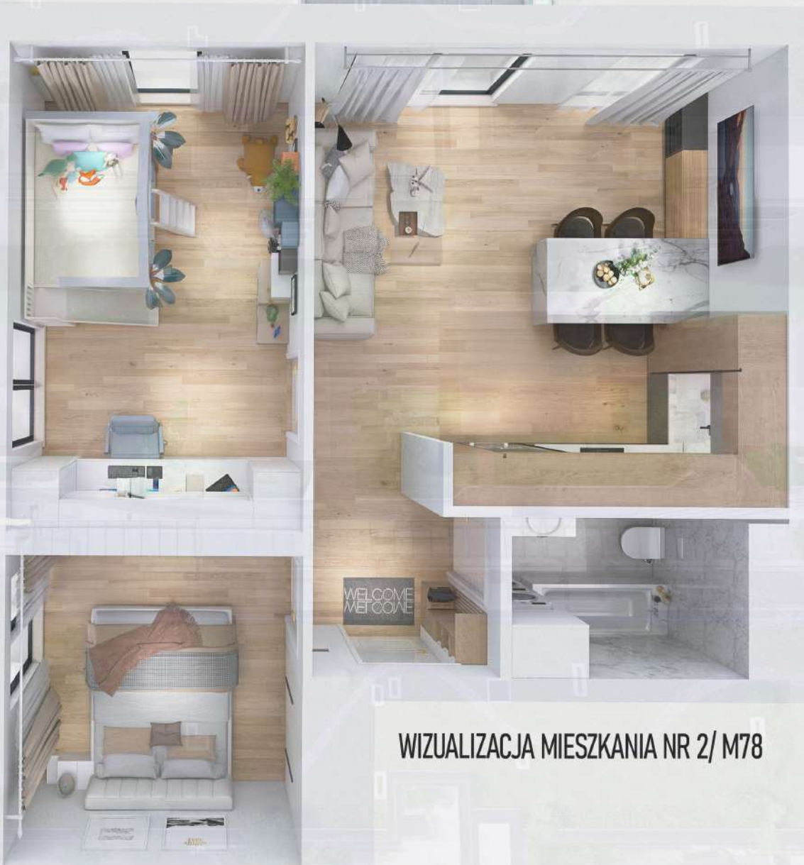
WIZUALIZACJA MIESZKANIA NR 2/ M78

Mniejszy projekt przedstawia przykładową aranżację. Mieszkania sprzedawane są w stanie deweloperskim bez wyposażenia. Podane wymiary są poglądowe i mogą ulec zmianie na etapie projektu wykonawczego i realizacji. Powierzchnie są liczone w świetle murów z warstwami wykończeniowymi