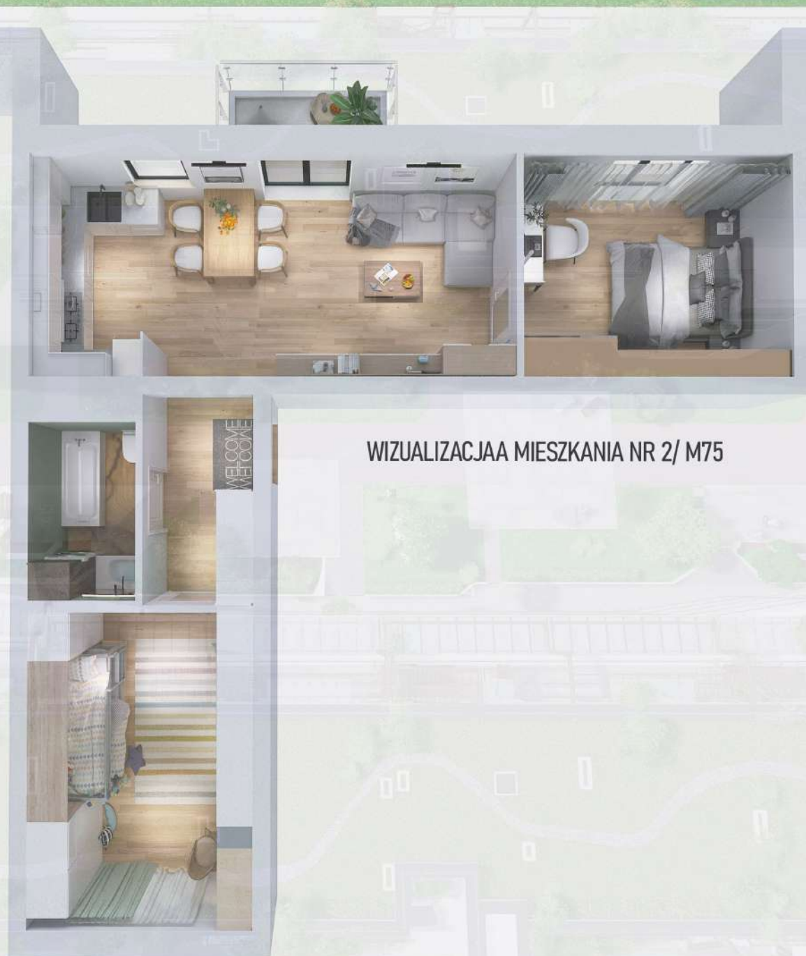
WIZUALIZACJAA MIESZKANIA NR 2/ M75

Niniejszy projekt przedstawia przykładową aranżację. Mieszkania sprzedawane są w stanie deweloperskim bez wyposażenia. Podane wymiary są poglądowe i mogą ulec zmianie na etapie projektu wykonawczego i realizacji. Powierzchnie są liczone w świetle murów z warstwami wykończeniowymi