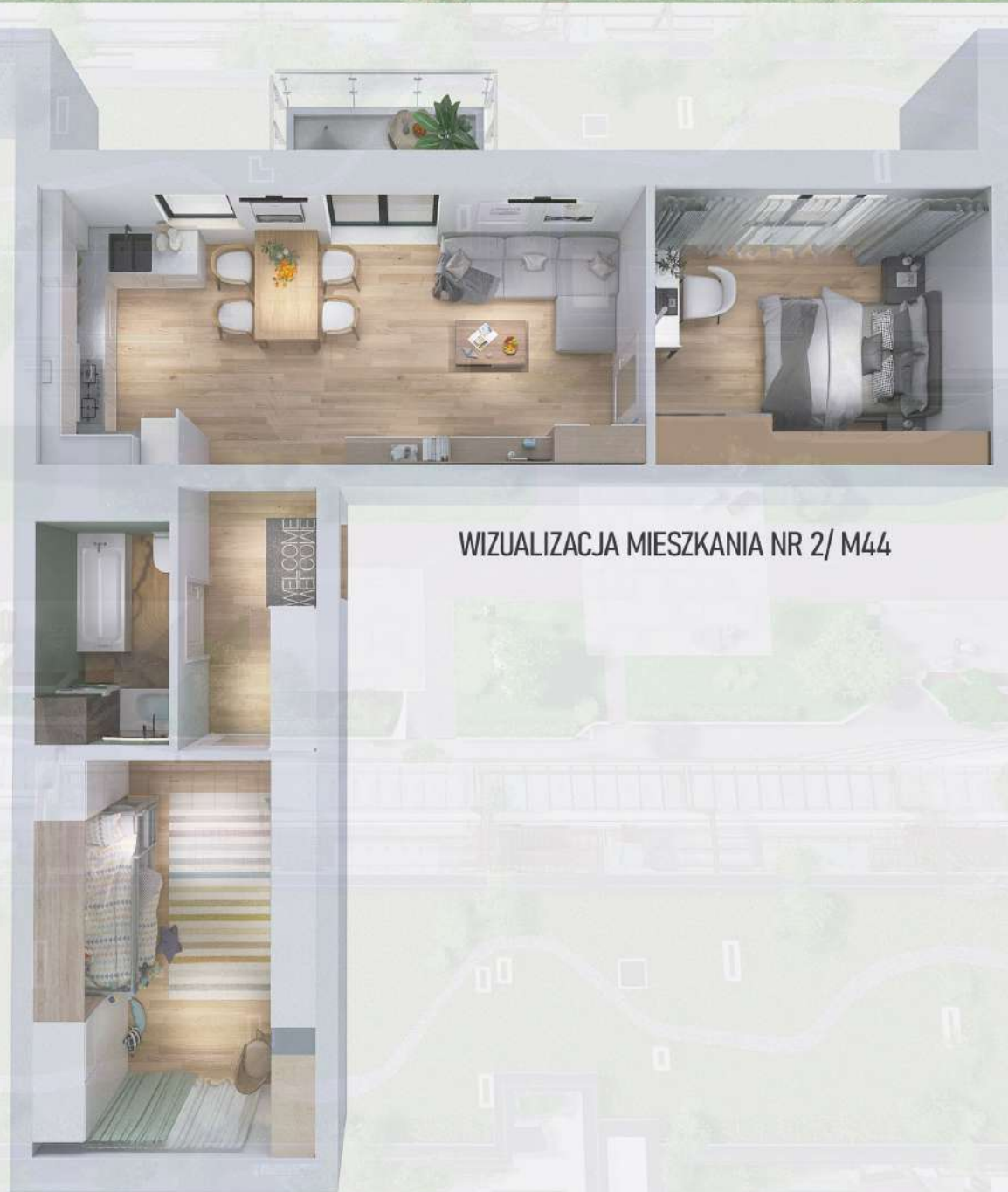
WIZUALIZACJA MIESZKANIA NR 2/ M44

Niniejszy projekt przedstawia przykładową aranżację. Mieszkania sprzedawane są w stanie deweloperskim bez wyposażenia. Podane wymiary są poglądowe i mogą ulec zmianie na etapie projektu wykonawczego i realizacji. Powierzchnie są liczone w świetle murów z warstwami wykończeniowymi