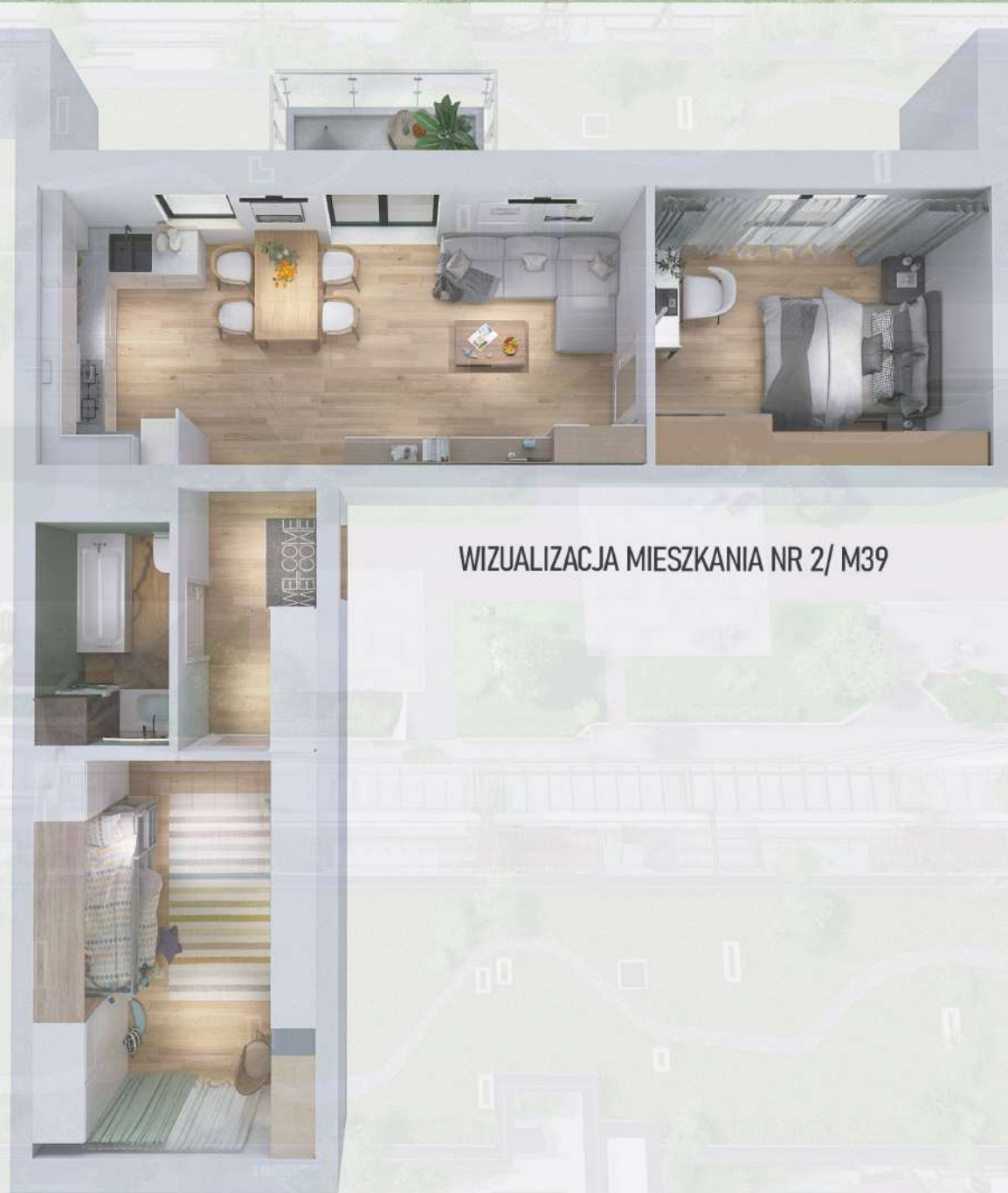
WIZUALIZACJA MIESZKANIA NR 2/ M39

Niniejszy projekt przedstawia przykładową aranżację. Mieszkania sprzedawane są w stanie deweloperskim bez wyposażenia. Podane wymiary są poglądowe i mogą ulec zmianie na etapie projektu wykonawczego i realizacji. Powierzchnie są liczone w świetle murów z warstwami wykończeniowymi