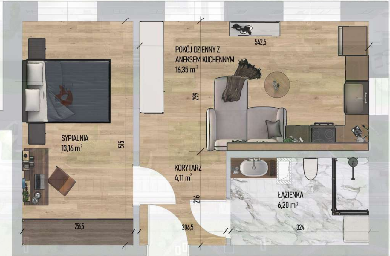
RZUT MIESZKANIA NR 1/ M65

Niniejszy projekt przedstawia przykładową aranżację. Mieszkania sprzedawane są w stanie deweloperskim bez wyposażenia. Podane wymiary są poglądowe i mogą ulec zmianie na etapie projektu wykonawczego i realizacji. Powierzchnie są liczone w świetle murów z warstwami wykończeniowymi.