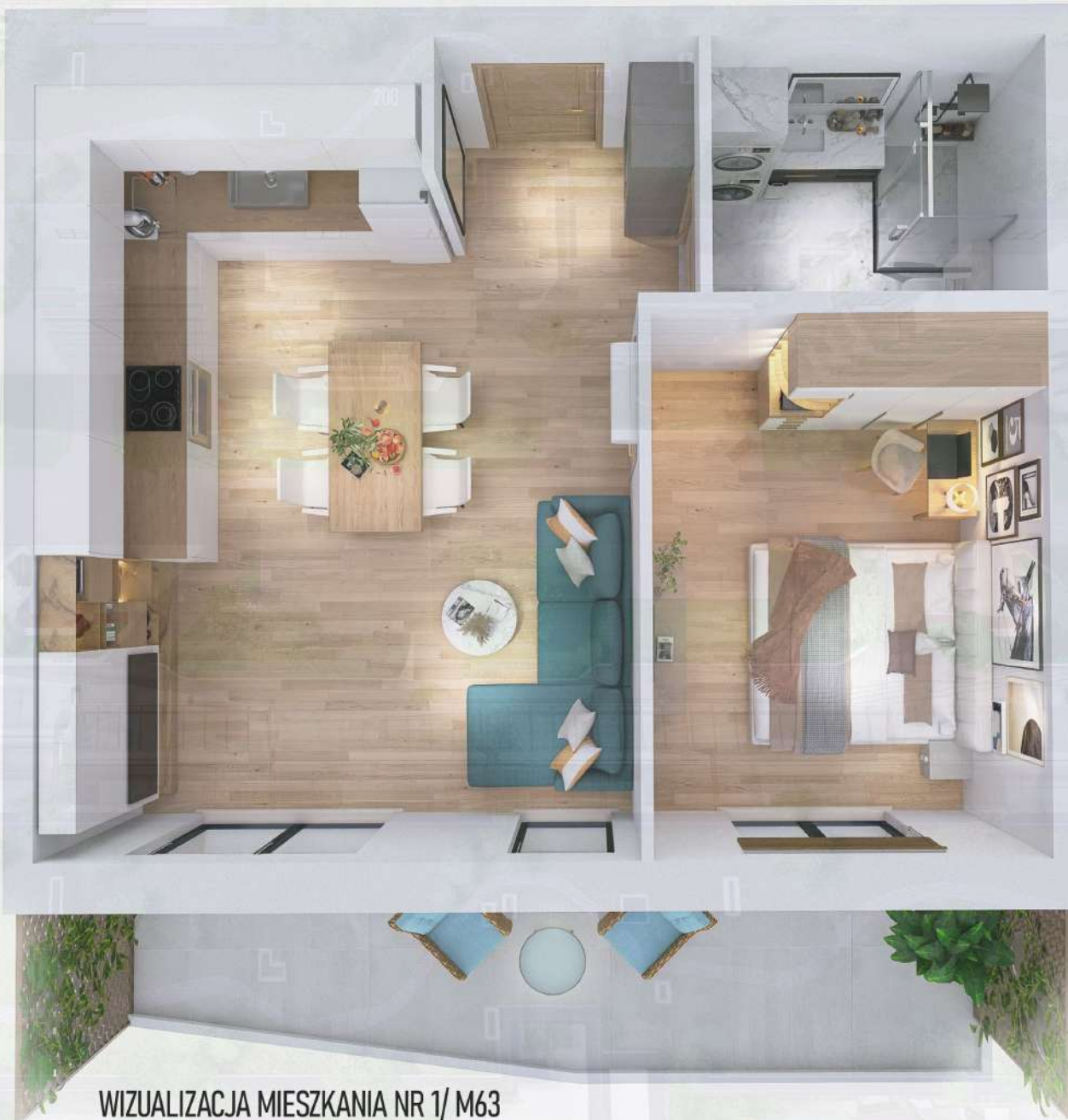
WIZUALIZACJA MIESZKANIA NR 1/ M63

Niniejszy projekt przedstawia przykładową aranżację. Mieszkania sprzedawane są w stanie deweloperskim bez wyposażenia. Podane wymiary są poglądowe i mogą ulec zmianie na etapie projektu wykonawczego i realizacji. Powierzchnie są liczone w świetle murów z warstwami wykończeniowymi