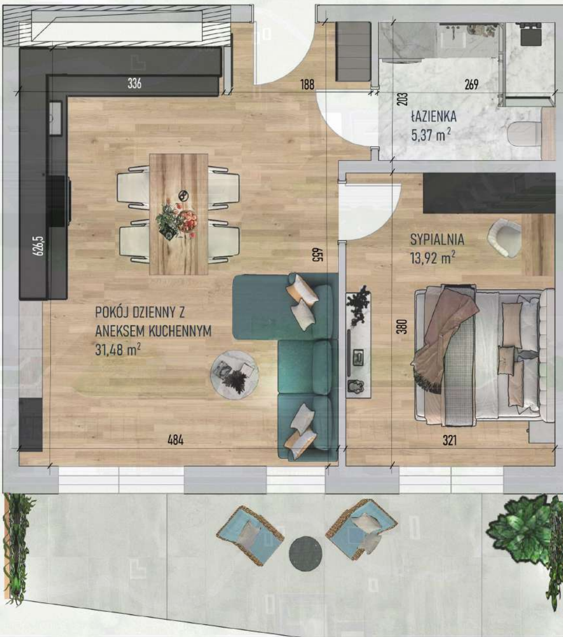
RZUT MIESZKANIA NR 1/ M63

Mniejszy projekt przedstawia przykładową aranżację. Mieszkania sprzedawane są w stanie deweloperskim bez wyposażenia. Podane wymiary są poglądowe i mogą ulec zmianie na etapie projektu wykonawczego i realizacji. Powierzchnie są liczone w świetle murów z warstwami wykończeniowymi