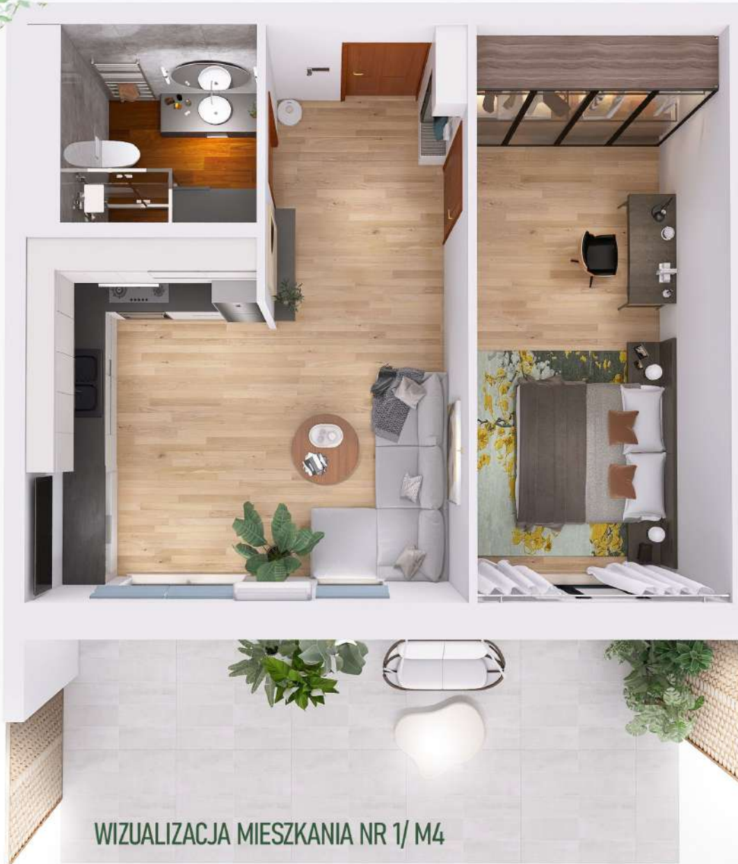
WIZUALIZACJA MIESZKANIA NR 1/ M4

Mniejszy projekt przedstawia przykładową aranżację. Mieszkania sprzedawane są w stanie deweloperskim bez wyposażenia. Podane wymiary są poglądowe i mogą ulec zmianie na etapie projektu wykonawczego i realizacji. Powierzchnie są liczone w świetle murów z warstwami wykończeniowymi