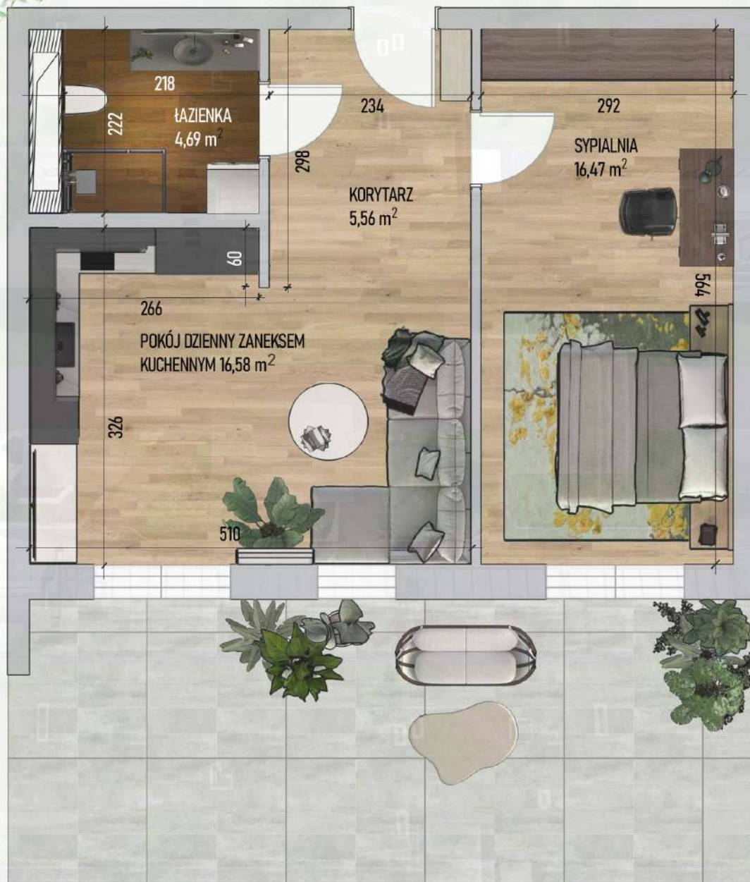
RZUT MIESZKANIA NR 1/ M4

Niniejszy projekt przedstawia przykładową aranżację. Mieszkania sprzedawane są w stanie deweloperskim bez wyposażenia. Podane wymiary są poglądowe i mogą ulec zmianie na etapie projektu wykonawczego i realizacji. Powierzchnie są liczone w świetle murów z warstwami wykończeniowymi