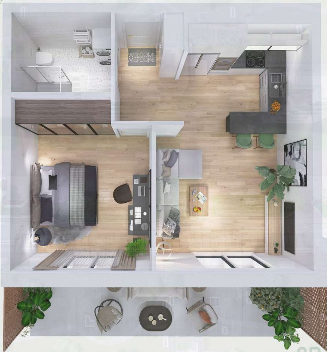
WIZUALIZACJA MIESZKANIA NR 1/ M3