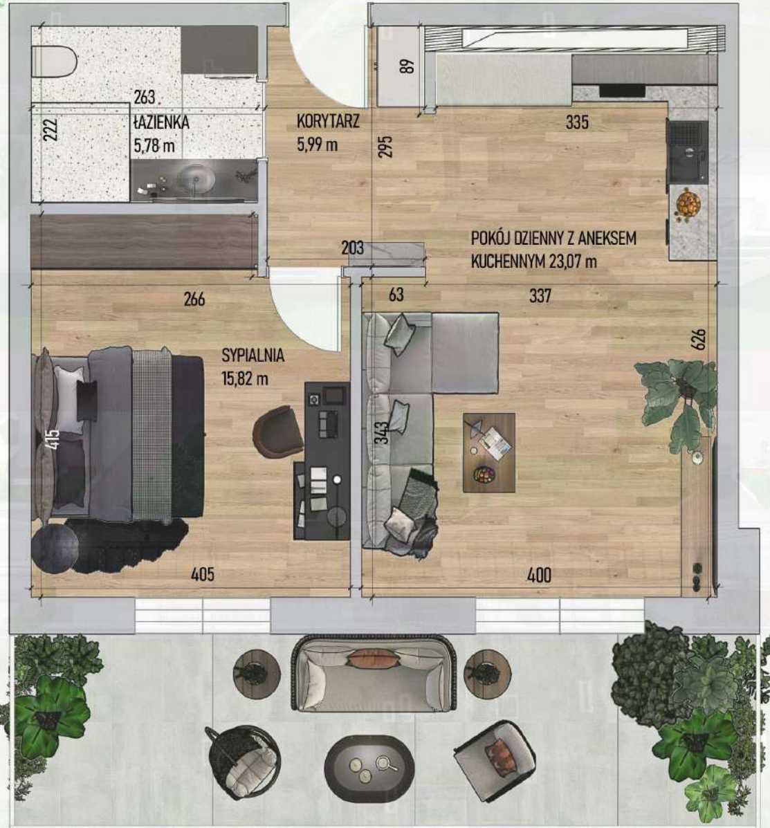
RZUT MIESZKANIA NR 1/ M3