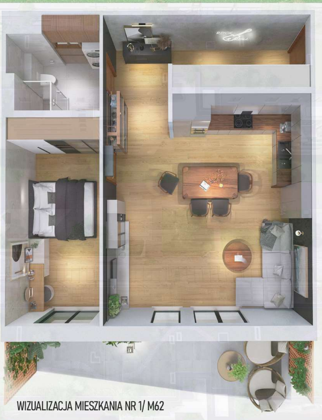
WIZUALIZACJA MIESZKANIA NR 1/ M62

Niniejszy projekt przedstawia przykładową aranżację. Mieszkania sprzedawane są w stanie deweloperskim bez wyposażenia. Podane wymiary są poglądowe i mogą ulec zmianie na etapie projektu wykonawczego i realizacji. Powierzchnie są liczone w świetle murów z warstwami wykończeniowymi.