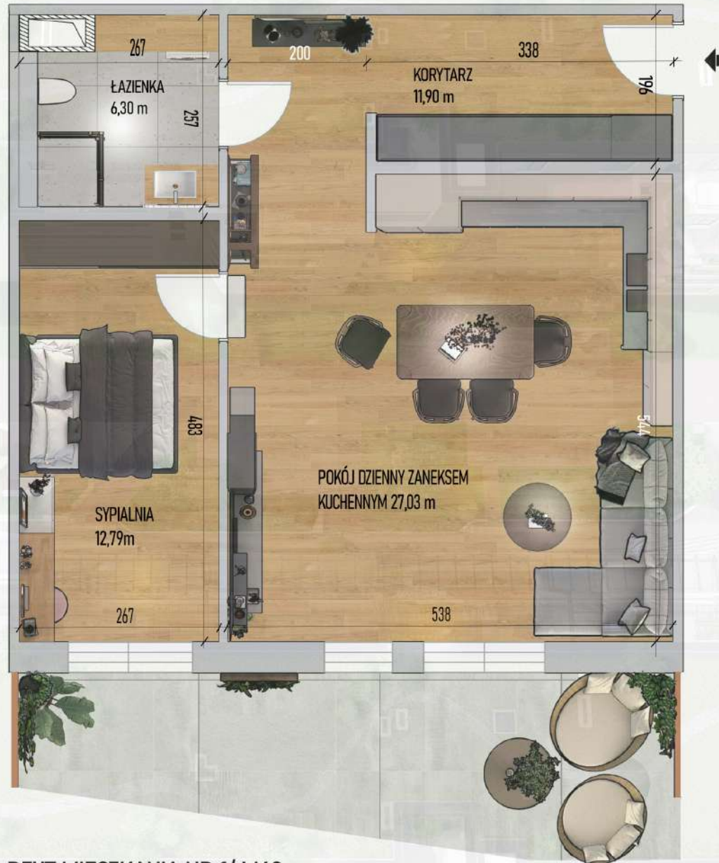
RZUT MIESZKANIA NR 1/ M62

Niniejszy projekt przedstawia przykładową aranżację. Mieszkania sprzedawane są w stanie deweloperskim bez wyposażenia. Podane wymiary są poglądowe i mogą ulec zmianie na etapie projektu wykonawczego i realizacji. Powierzchnie są liczone w świetle murów z warstwami wykończeniowymi