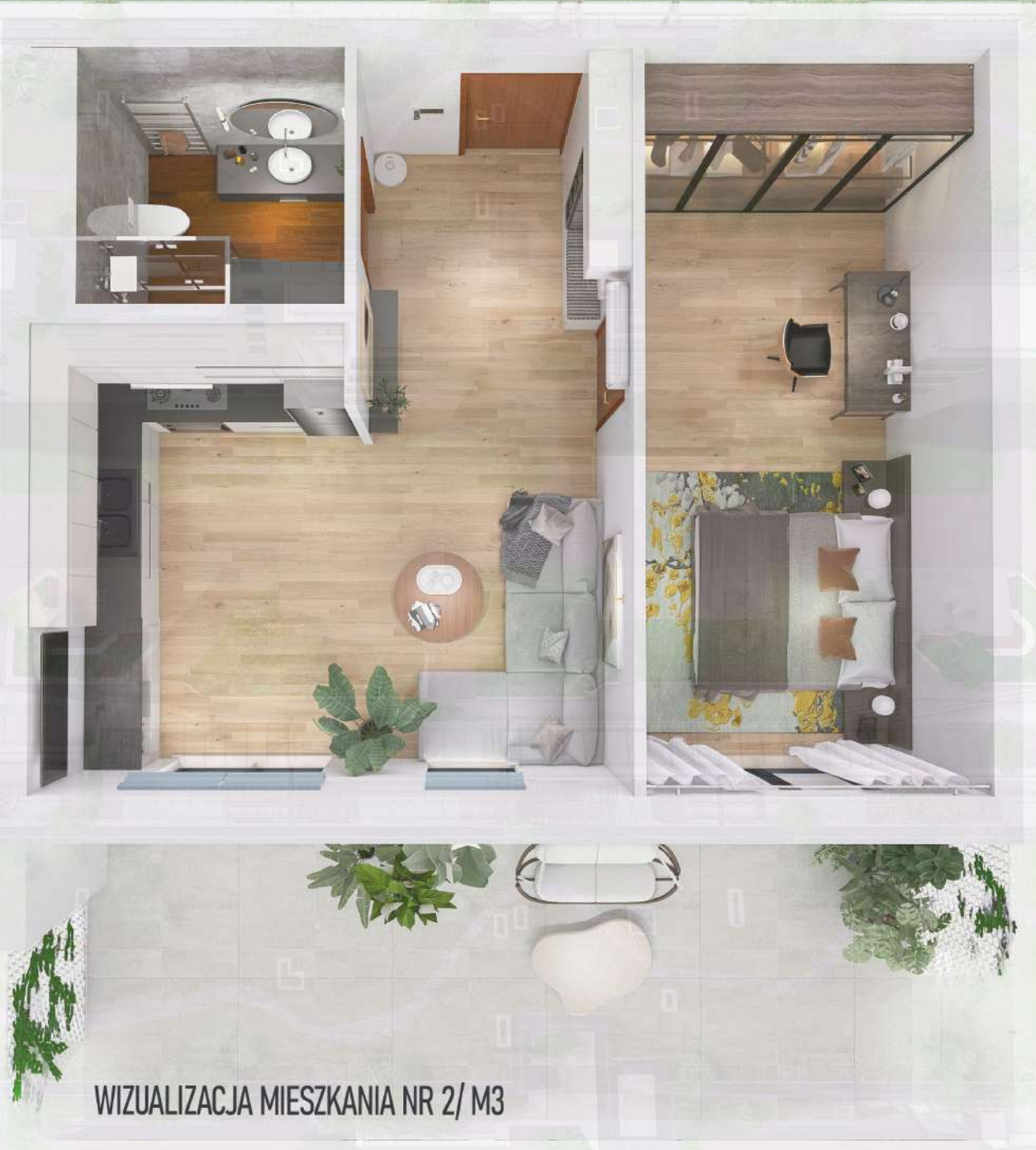
WIZUALIZACJA MIESZKANIA NR 2/ M3

Mniejszy projekt przedstawia przykładową aranżację. Mieszkania sprzedawane są w stanie deweloperskim bez wyposażenia. Podane wymiary są poglądowe i mogą ulec zmianie na etapie projektu wykonawczego i realizacji. Powierzchnie są liczone w świetle murów z warstwami wykończeniowymi