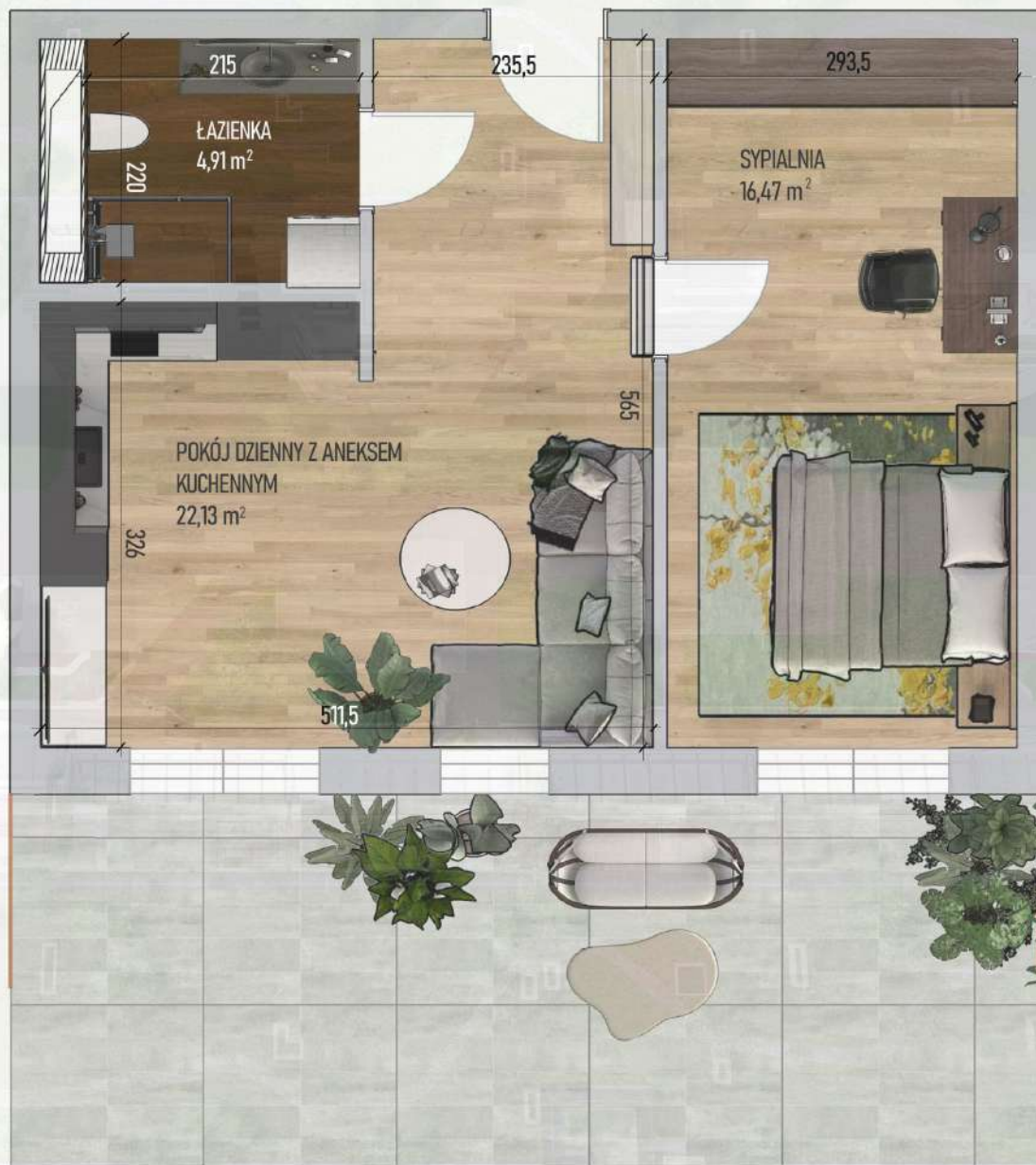
RZUT MIESZKANIA NR 2/ M3

Mniejszy projekt przedstawia przykładową aranżację. Mieszkania sprzedawane są w stanie deweloperskim bez wyposażenia. Podane wymiary są poglądowe i mogą ulec zmianie na etapie projektu wykonawczego i realizacji. Powierzchnie są liczone w świetle murów z warstwami wykończeniowymi