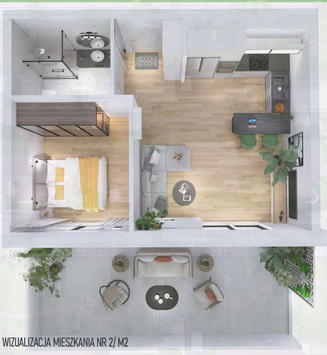
WIZUALIZACJA MIESZKANIA NR 2/ M2

Niniejszy projekt przedstawia przykładową aranżację. Mieszkania sprzedawane są w stanie deweloperskim bez wyposażenia. Podane wymiary są poglądowe i mogą ulec zmianie na etapie projektu wykonawczego i realizacji. Powierzchnie są liczone w świetle murów z warstwami wykończeniowymi.