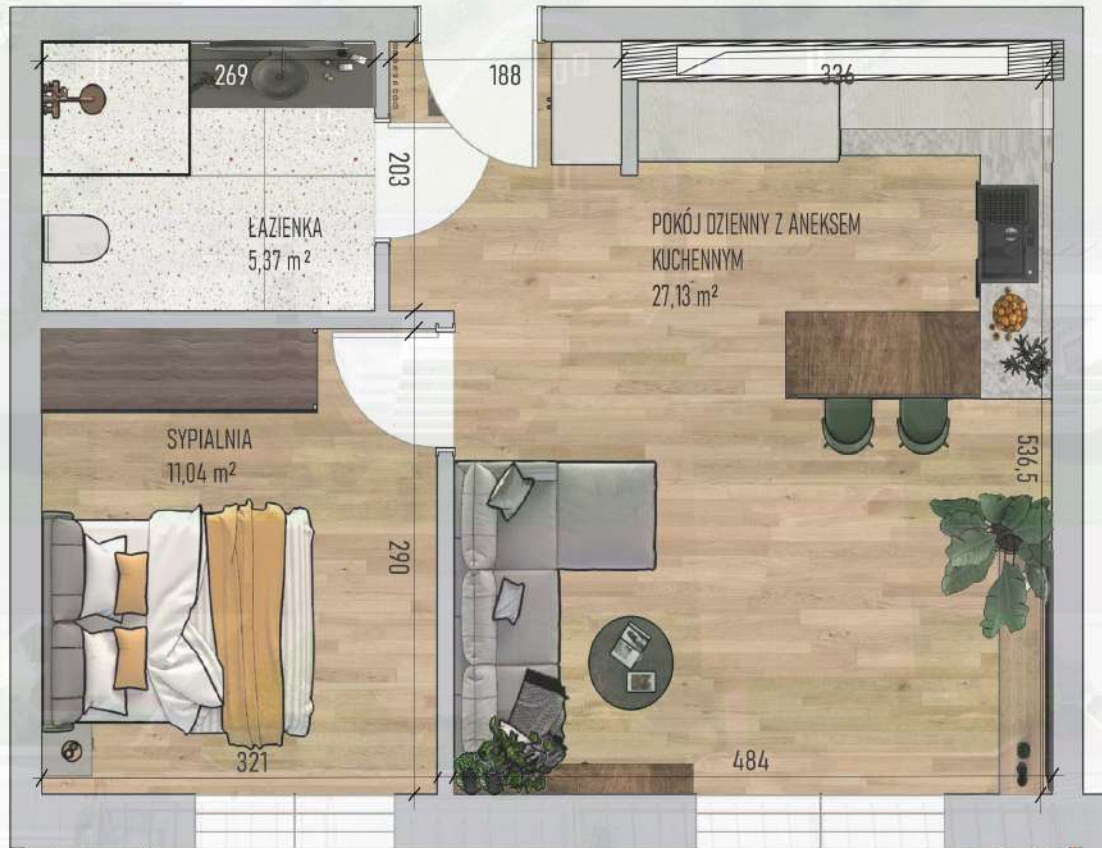
RZUT MIESZKANIA NR 2/ M2

Mniejszy projekt przedstawia przykładową aranżację. Mieszkania sprzedawane są w stanie deweloperskim bez wyposażenia. Podane wymiary są poglądowe i mogą ulec zmianie na etapie projektu wykonawczego i realizacji. Powierzchnie są liczone w świetle murów z warstwami wykończeniowymi