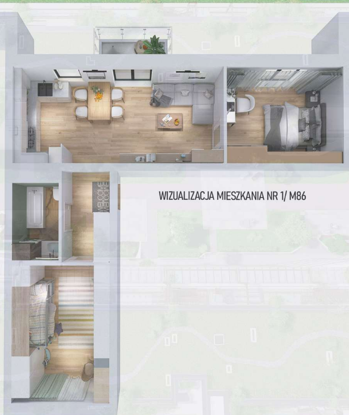
WIZUALIZACJA MIESZKANIA NR 1/ M86

Niniejszy projekt przedstawia przykładową aranżację. Mieszkania sprzedawane są w stanie deweloperskim bez wyposażenia. Podane wymiary są poglądowe i mogą ulec zmianie na etapie projektu wykonawczego i realizacji. Powierzchnie są liczone w świetle murów z warstwami wykończeniowymi