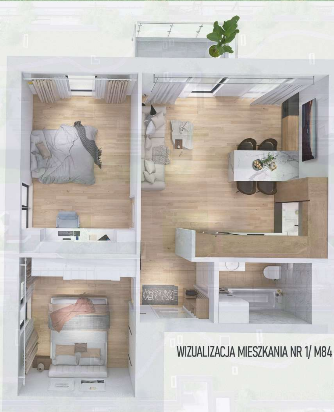
WIZUALIZACJA MIESZKANIA NR 1/ M84

Niniejszy projekt przedstawia przykładową aranżację. Mieszkania sprzedawane są w stanie deweloperskim bez wyposażenia. Podane wymiary są poglądowe i mogą ulec zmianie na etapie projektu wykonawczego i realizacji. Powierzchnie są liczone w świetle murów z warstwami wykończeniowymi