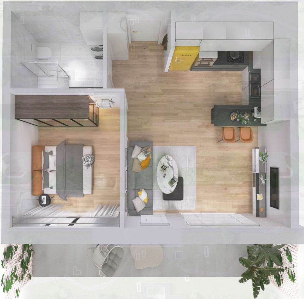
WIZUALIZACJA MIESZKANIA NR1/M33

Niniejszy projekt przedstawia przykładową aranżację. Mieszkania sprzedawane są w stanie deweloperskim bez wyposażenia. Podane wymiary są poglądowe i mogą ulec zmianie na etapie projektu wykonawczego i realizacji. Powierzchnie są liczone w świetle murów z warstwami wykończeniowymi.