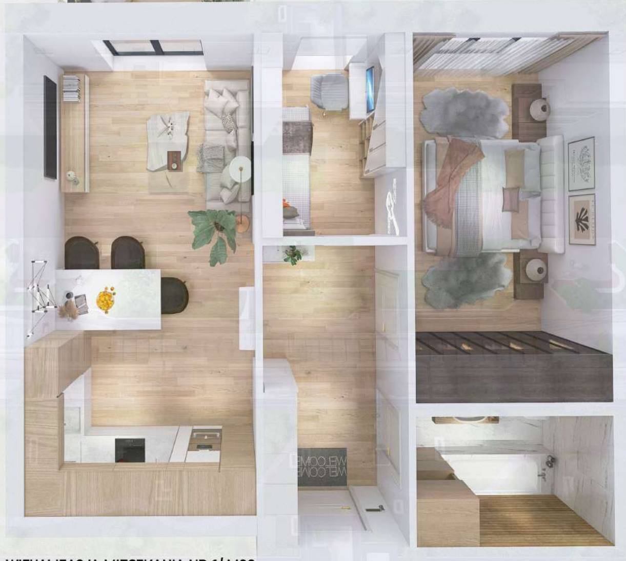
WIZUALIZACJA MIESZKANIA NR 1/ M22

Miniejszy projekt przedstawia przykładową aranżację. Mieszkania sprzedawane są w stanie deweloperskim bez wyposażenia. Podane wymiary są poglądowe i mogą ulec zmianie na etapie projektu wykonawczego i realizacji. Powierzchnie są liczone w świetle murów z warstwami wykończeniowymi