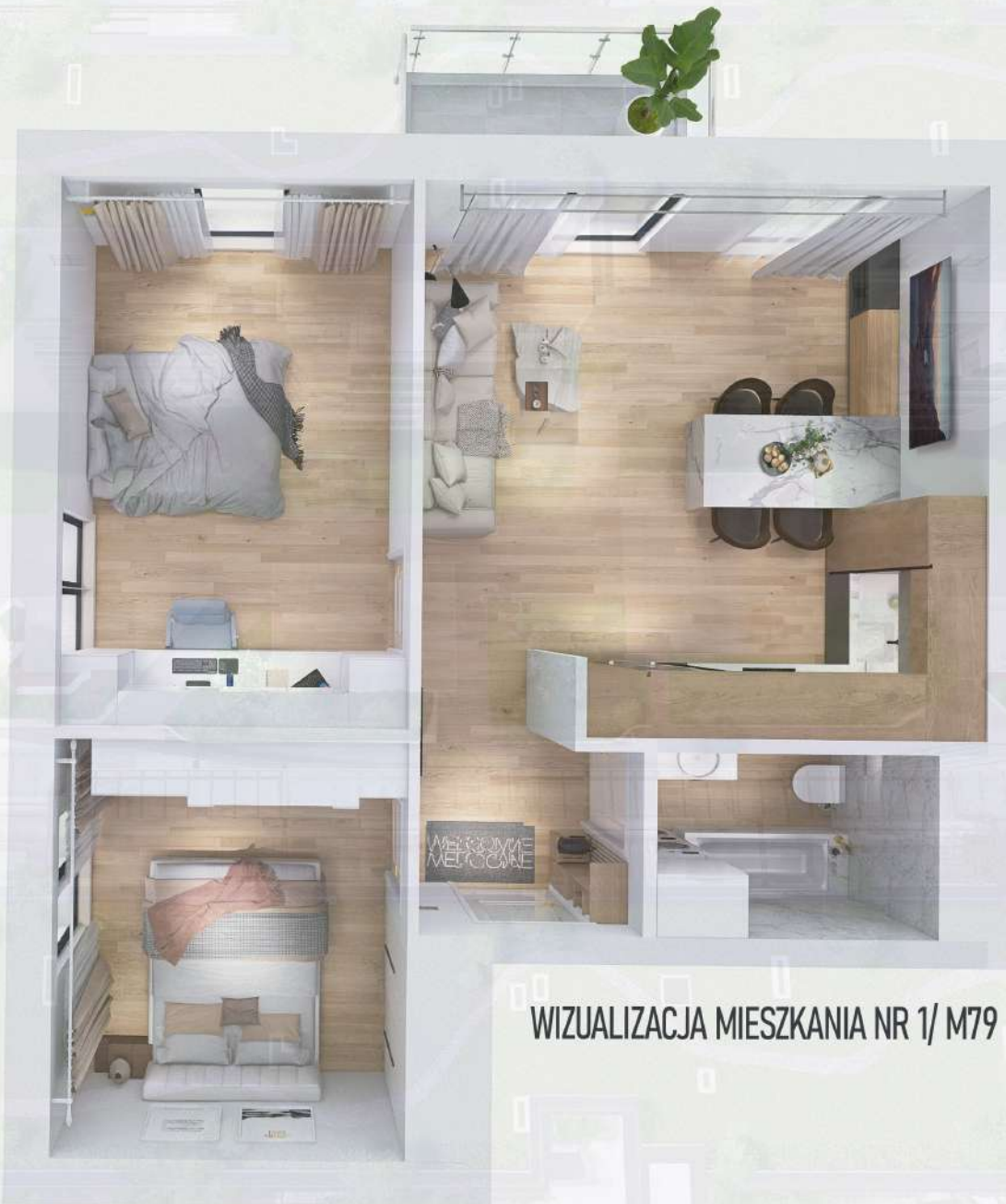
WIZUALIZACJA MIESZKANIA NR 1/ M79

Niniejszy projekt przedstawia przykładową aranżację. Mieszkania sprzedawane są w stanie deweloperskim bez wyposażenia. Podane wymiary są poglądowe i mogą ulec zmianie na etapie projektu wykonawczego i realizacji. Powierzchnie są liczone w świetle murów z warstwami wykończeniowymi