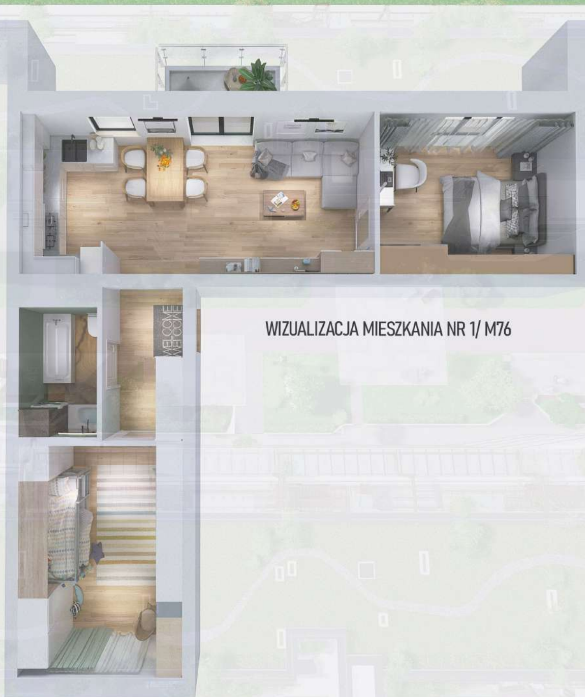
WIZUALIZACJA MIESZKANIA NR 1/ M76

Niniejszy projekt przedstawia przykładową aranżację. Mieszkania sprzedawane są w stanie deweloperskim bez wyposażenia. Podane wymiary są poglądowe i mogą ulec zmianie na etapie projektu wykonawczego i realizacji. Powierzchnie są liczone w świetle murów z warstwami wykończeniowymi