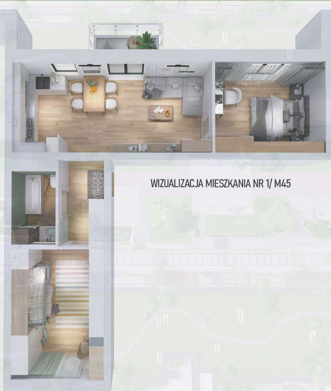
WIZUALIZACJA MIESZKANIA NR 1/ M45

Niniejszy projekt przedstawia przykładową aranżację. Mieszkania sprzedawane są w stanie deweloperskim bez wyposażenia. Podane wymiary są poglądowe i mogą ulec zmianie na etapie projektu wykonawczego i realizacji. Powierzchnie są liczone w świetle murów z warstwami wykończeniowymi