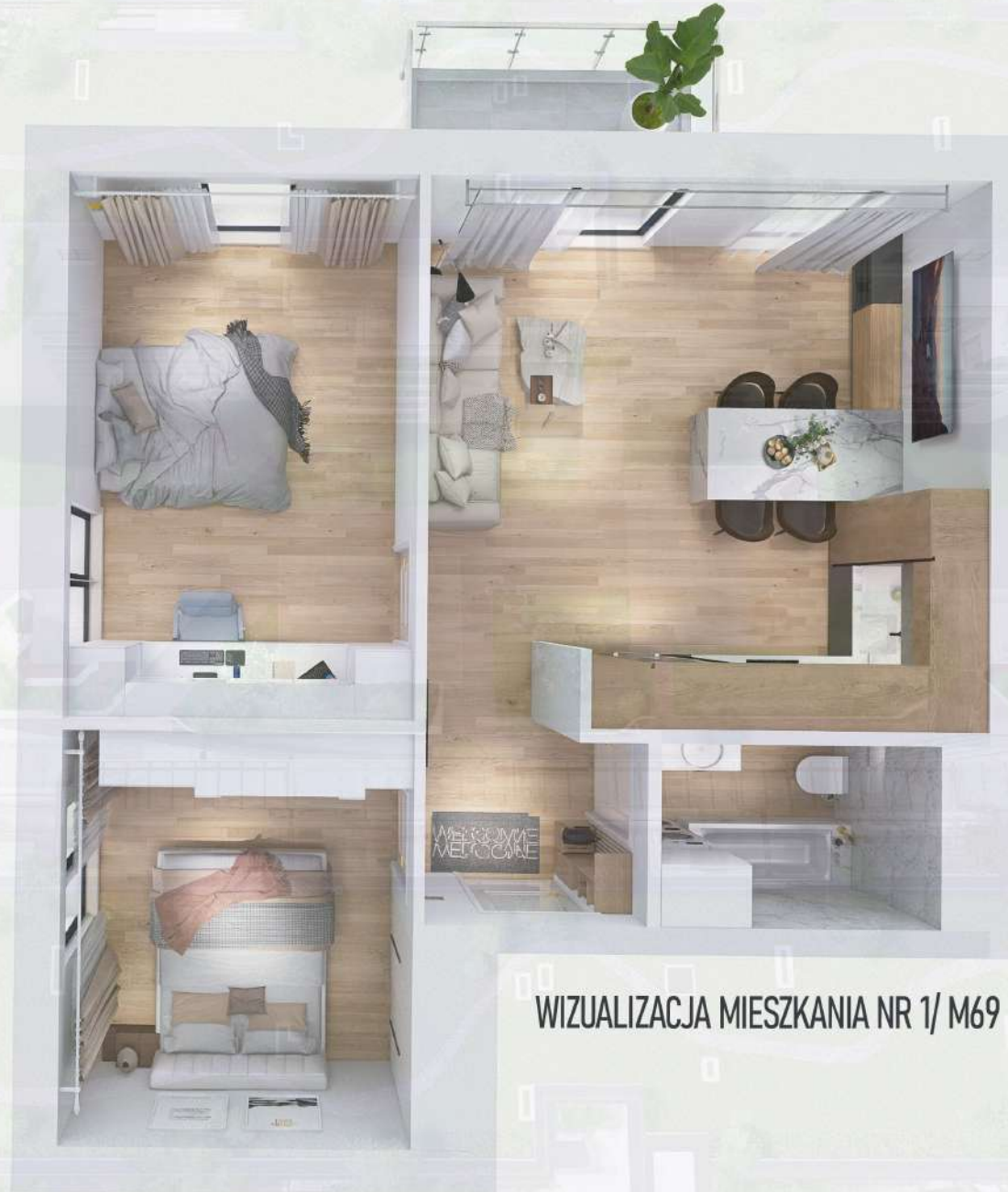
WIZUALIZACJA MIESZKANIA NR 1/ M69

Mniejszy projekt przedstawia przykładową aranżację. Mieszkania sprzedawane są w stanie deweloperskim bez wyposażenia. Podane wymiary są poglądowe i mogą ulec zmianie na etapie projektu wykonawczego i realizacji. Powierzchnie są liczone w świetle murów z warstwami wykończeniowymi