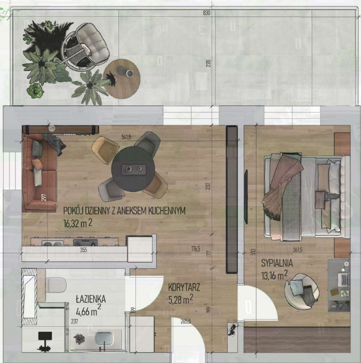
RZUT MIESZKANIA NR 1/ M1