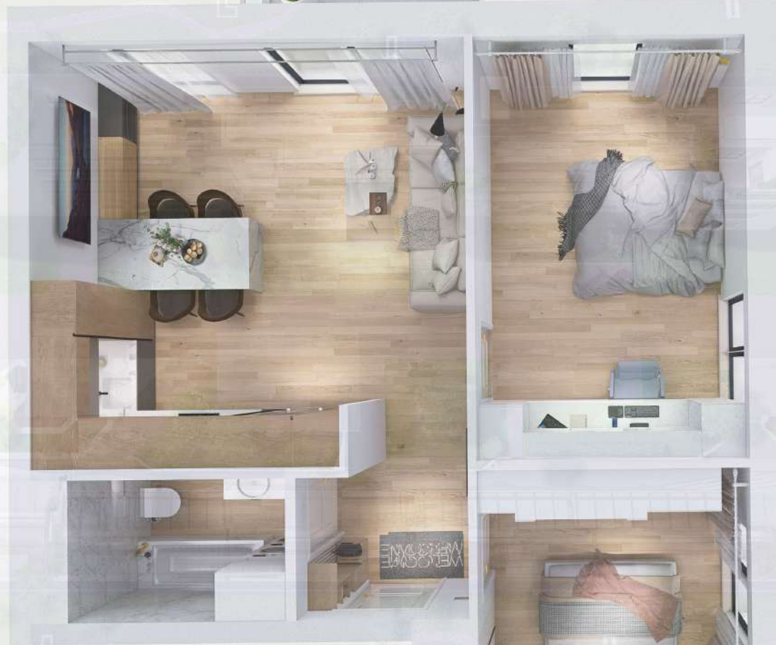
WIZUALIZACJA MIESZKANIA NR 1/ M6

Miniejszy projekt przedstawia przykładową aranżację. Mieszkania sprzedawane są w stanie deweloperskim bez wyposażenia. Podane wymiary są poglądowe i mogą ulec zmianie na etapie projektu wykonawczego i realizacji. Powierzchnie są liczone w świetle murów z warstwami wykończeniowymi