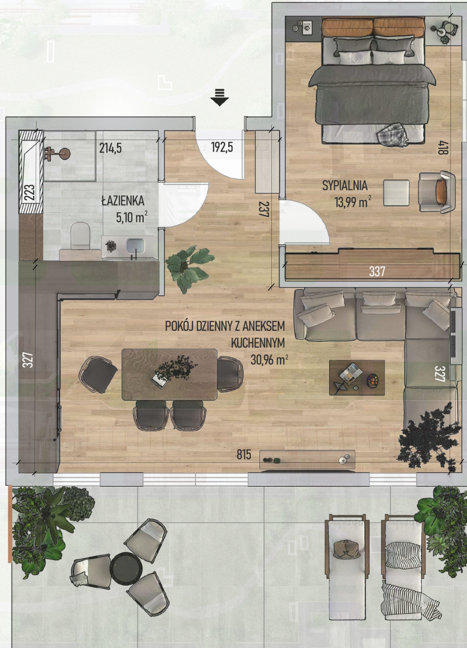
RZUT MIESZKANIA NR 2/ M63

Niniejszy projekt przedstawia przykładową aranżację. Mieszkania sprzedawane są w stanie deweloperskim bez wyposażenia. Podane wymiary są poglądowe i mogą ulec zmianie na etapie projektu wykonawczego i realizacji. Powierzchnie są liczone w świetle murów z warstwami wykończeniowymi.