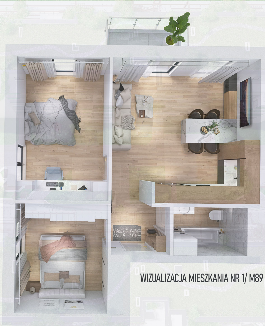
WIZUALIZACJA MIESZKANIA NR 1/ M89

Niniejszy projekt przedstawia przykładową aranżację. Mieszkania sprzedawane są w stanie deweloperskim bez wyposażenia. Podane wymiary są poglądowe i mogą ulec zmianie na etapie projektu wykonawczego i realizacji. Powierzchnie są liczone w świetle murów z warstwami wykończeniowymi