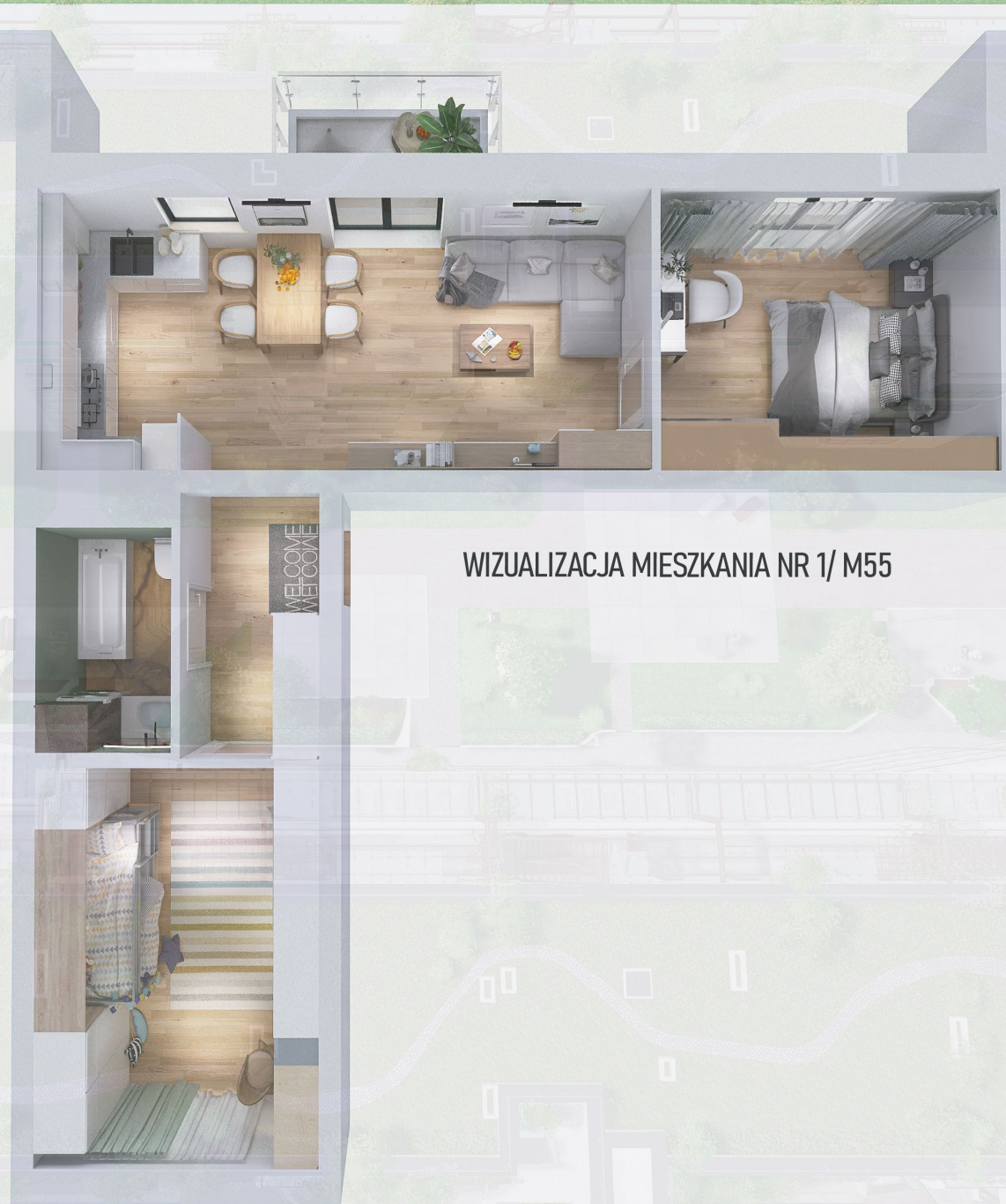
WIZUALIZACJA MIESZKANIA NR 1/ M55

Niniejszy projekt przedstawia przykładową aranżację. Mieszkania sprzedawane są w stanie deweloperskim bez wyposażenia. Podane wymiary są poglądowe i mogą ulec zmianie na etapie projektu wykonawczego i realizacji. Powierzchnie są liczone w świetle murów z warstwami wykończeniowymi