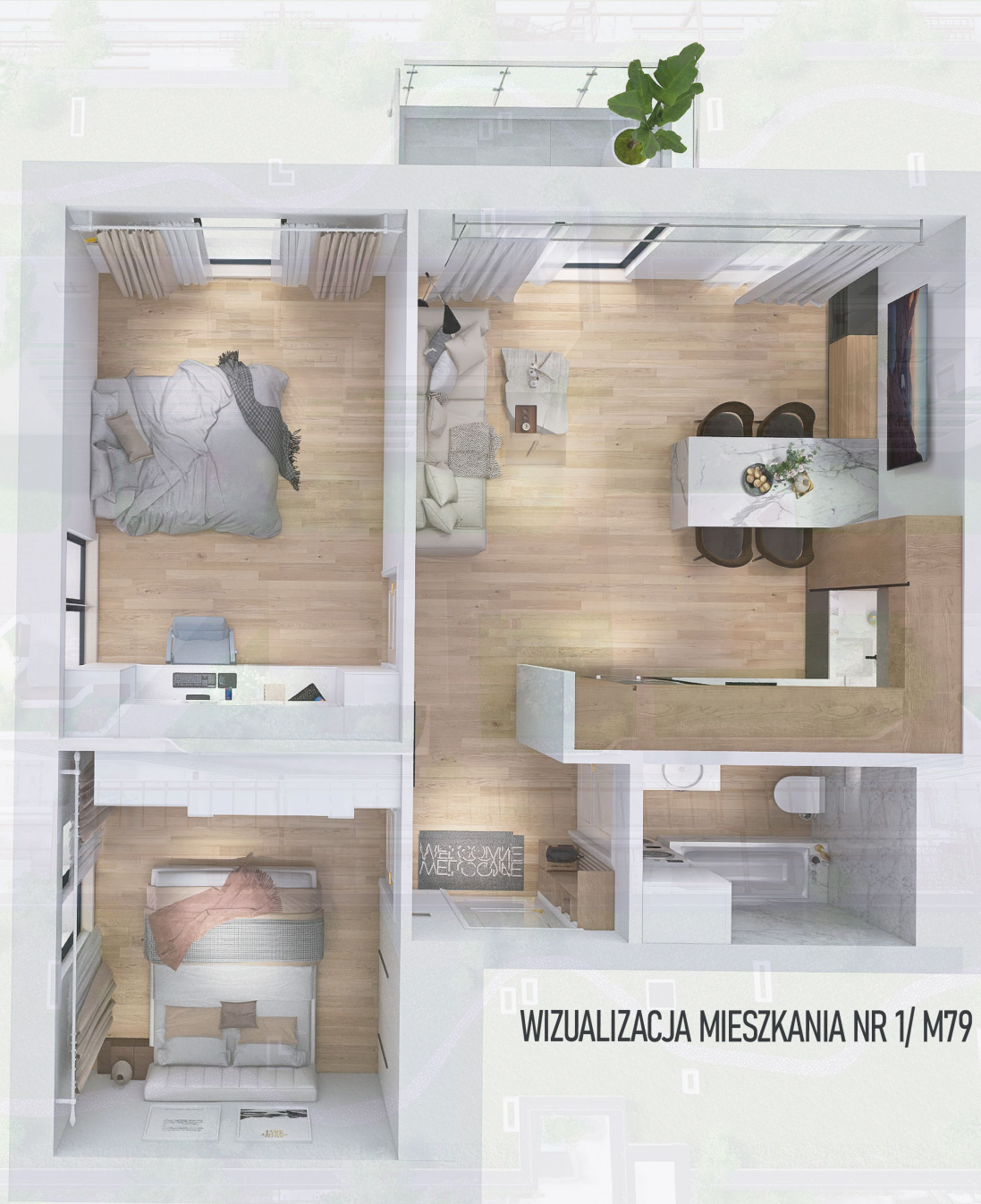
WIZUALIZACJA MIESZKANIA NR 1/ M79

Niniejszy projekt przedstawia przykładową aranżację. Mieszkania sprzedawane są w stanie deweloperskim bez wyposażenia. Podane wymiary są poglądowe i mogą ulec zmianie na etapie projektu wykonawczego i realizacji. Powierzchnie są liczone w świetle murów z warstwami wykończeniowymi