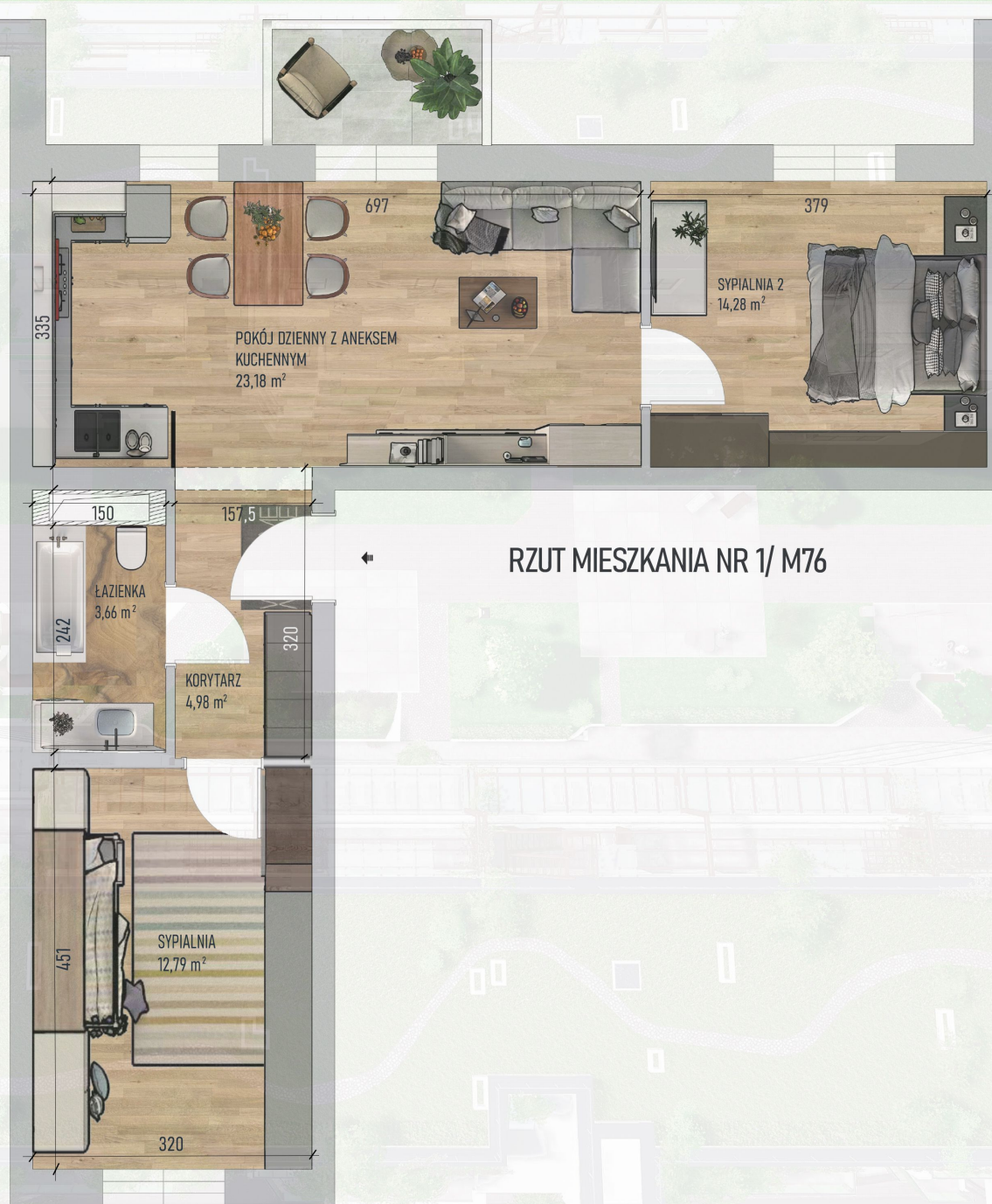
RZUT MIESZKANIA NR 1/ M76

Niniejszy projekt przedstawia przykładową aranżację. Mieszkania sprzedawane są w stanie deweloperskim bez wyposażenia. Podane wymiary są poglądowe i mogą ulec zmianie na etapie projektu wykonawczego i realizacji. Powierzchnie są liczone w świetle murów z warstwami wykończeniowymi.