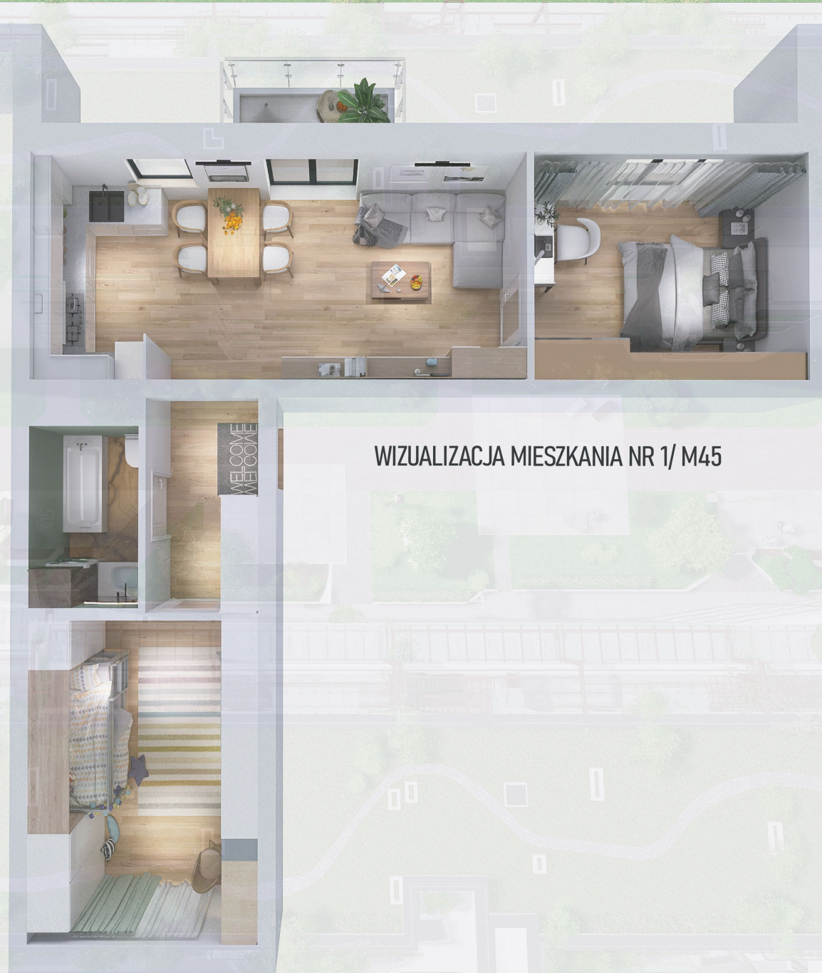
WIZUALIZACJA MIESZKANIA NR 1/ M45

Niniejszy projekt przedstawia przykładową aranżację. Mieszkania sprzedawane są w stanie deweloperskim bez wyposażenia. Podane wymiary są poglądowe i mogą ulec zmianie na etapie projektu wykonawczego i realizacji. Powierzchnie są liczone w świetle murów z warstwami wykończeniowymi.