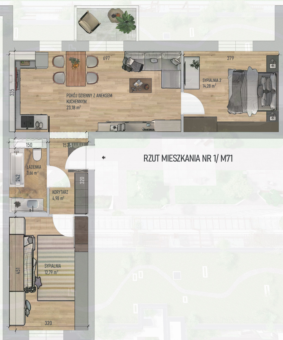
RZUT MIESZKANIA NR 1/ M71

Niniejszy projekt przedstawia przykładową aranżację. Mieszkania sprzedawane są w stanie deweloperskim bez wyposażenia. Podane wymiary są poglądowe i mogą ulec zmianie na etapie projektu wykonawczego i realizacji. Powierzchnie są liczone w świetle murów z warstwami wykończeniowymi.